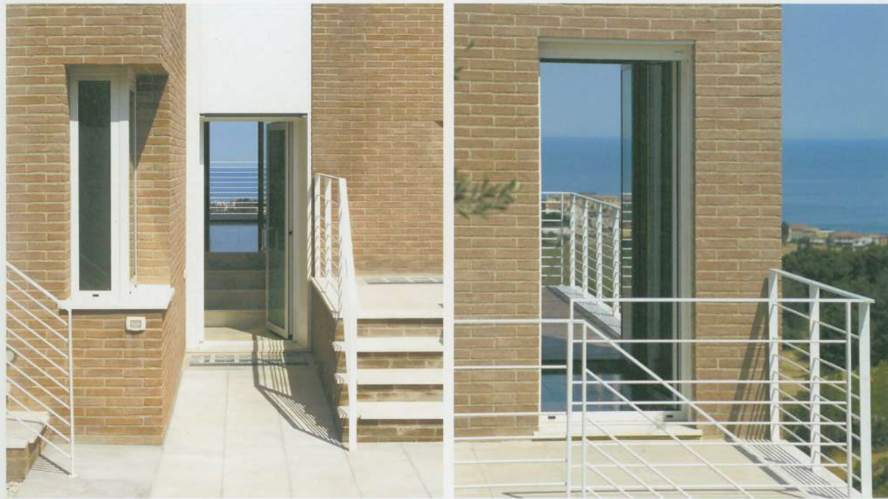
Las aberturas se han situado estratégicamente, de forma que incluso desde su fachada trasera, orientada hacia el interior, se puede disfrutar de las magnificas vistas al mar. Le aperture sono state inserite strategicamente, in modo che perfino dal lato posteriore, orientato verso l'interno, fosse possibile sfruttare la magnifica vista sul mare. As aberturas foram situadas estrategicamente para que desde a sua fachada traseira seja possível desfrutar de vistas para o mar.