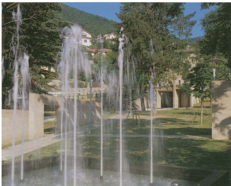
la grande vasca con la fontana