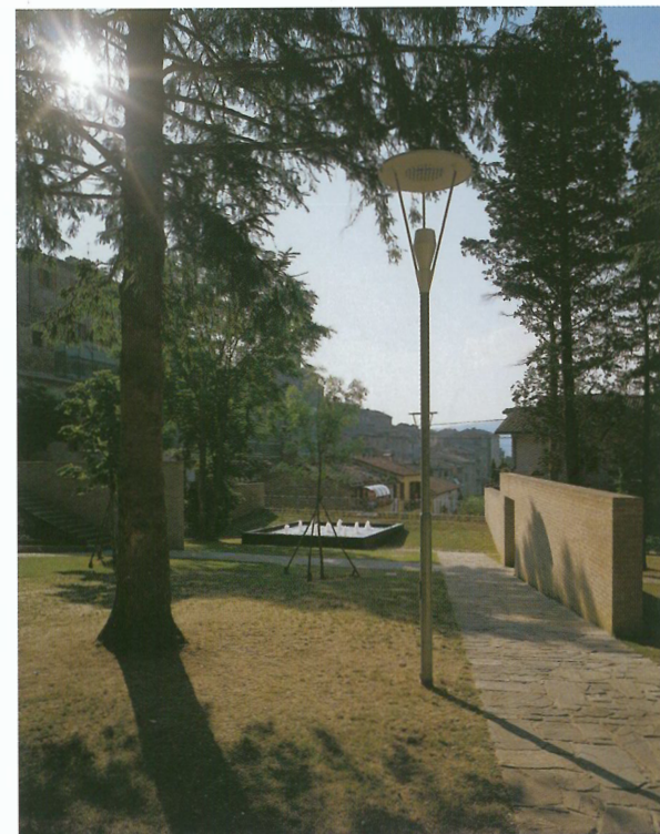
Il nuovo percorso pavimentato con selci di arenaria a grandi lastre e cordoli sempre di arenaia, termina nel grande basamento della vasca d'acqua rivestita in basalto